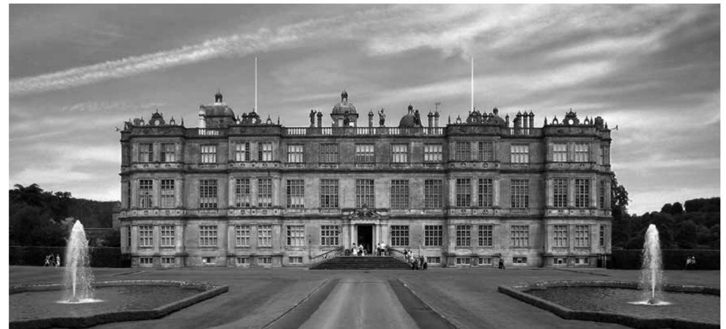
Longleat House - John of Padua

tro a Palazzo della Ragione, un antesignano "concept store" legato al culto del Santo e delle reliquie: sono tutte immagini che mi hanno segnato indelebilmente. Padova è il posto da dove vengo, ma anche quello in cui non voglio tornare: lì è archiviata la mia infanzia, e preferisco lasciarla ben chiusa dentro degli scatoloni che ogni tanto apro a distanza». La storia ciclicamente si ripete: da Palladio a Cattelan, "Nemo propheta in Padova"