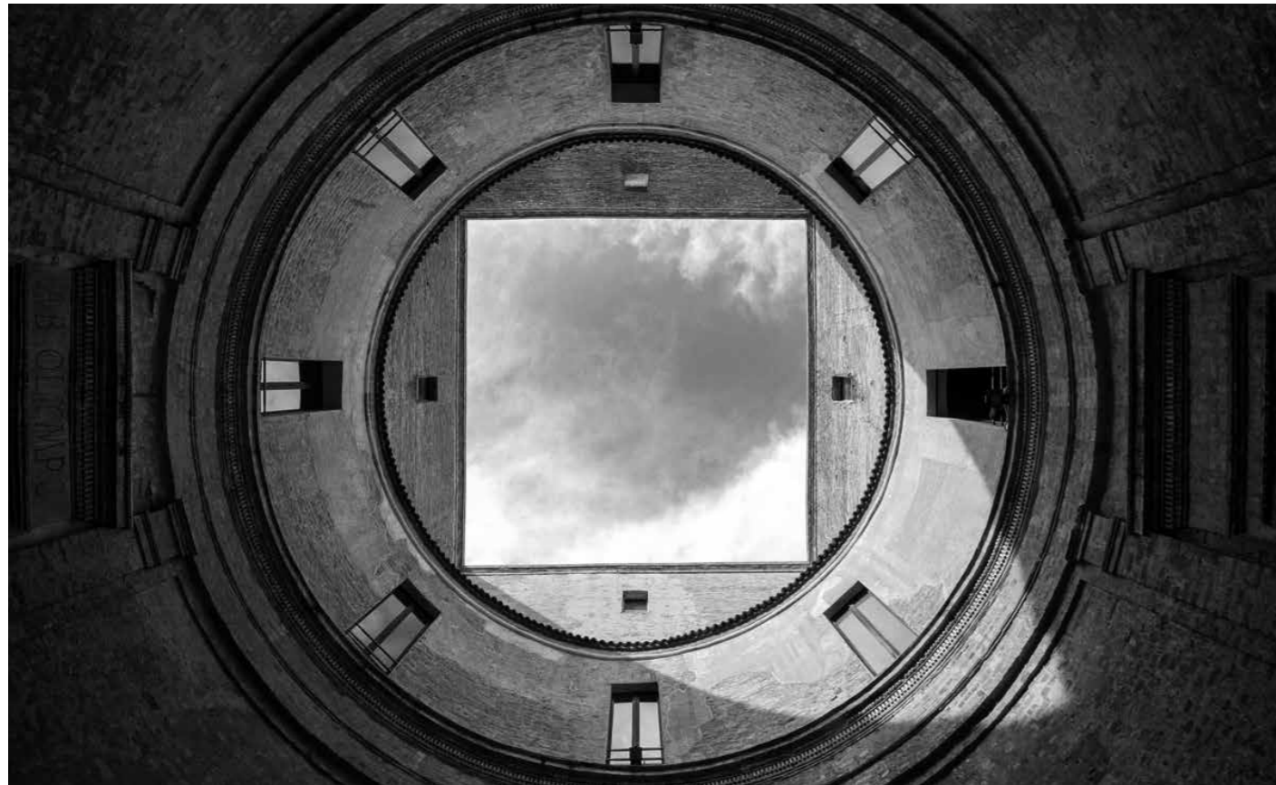
Casa del Mantegna - Andrea Mantegna