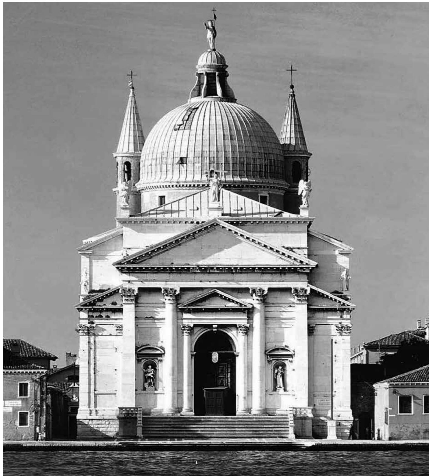
Sopra: Chiesa del Redentore - Andrea Palladio, Venezia