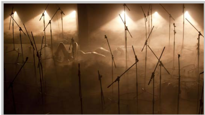
Tutto ciò che è grande è nella tempesta , regia Andrea De Rosa, 2011

P.M. Credere con piacere... Mi piace. E poi, parlando di bambini: ecco, io cerco di mantenere in me la situazione di piacere che dà la creazione di realtà che si vive nel gioco da bambini, che si vede nei giochi di proiezione che fanno i bambini nell'assoluta certezza di vivere nella realtà che si forma intorno a loro, sulla loro pelle... È la cosa che mi ha trasmesso, quando sono diventato più grande, il cinema: dimenticare tutto il resto. La parola illusione ha una parte proiettiva, desiderativa, di qualcosa che non si ottiene in quel momento o che si ottiene temporaneamente e se qualcuno si accorge di queste esperienze, mentre le sta vivendo, è finito il gioco.