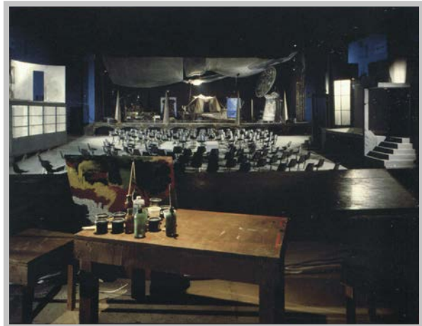
Falso Movimento, Ritorno ad Alphaville , regia Mario Martone, Benevento, 1986

Ecco un buon esempio di manipolazione della luce naturale per un fine che non è spettacolare o teatrale, un fine semplicemente di condivisione di una buona pratica fisica come quella del bagno turco – qualcosa che poi ho anche filmato nell'omonimo primo film di Ozpetek. Anche quello è un luogo che ha, come un osservatorio astronomico, i suoi occhi rivolti verso l'alto. È un luogo che mi sento addosso, lo porto sempre con me... Quando penso ad una pianta luci, a una disposizione di fonti di luce in uno spazio, è come se mi portassi appresso