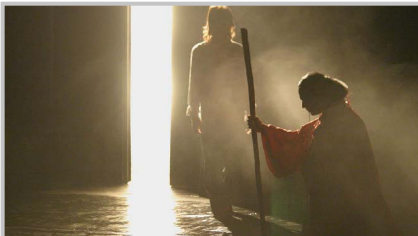
Curlew river , regia Andrea De Rosa, 2005 ©n.d. (autorizzazione del regista)