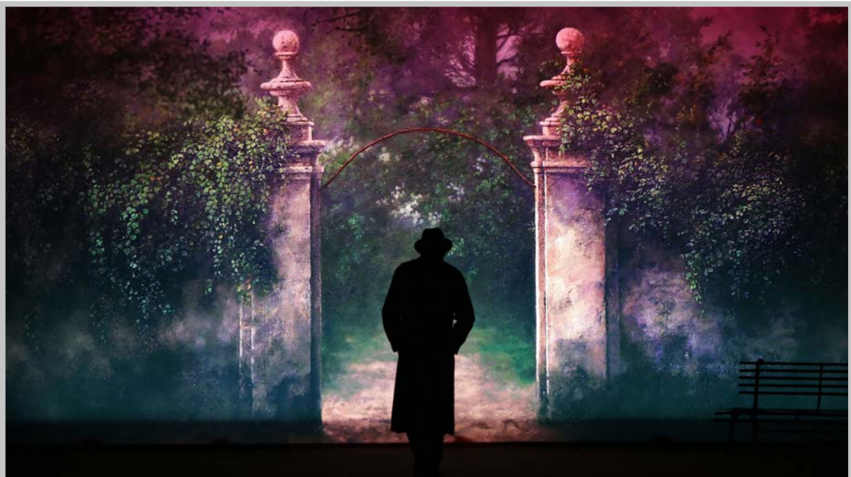
The Pride , regia Luca Zingaretti, 2015