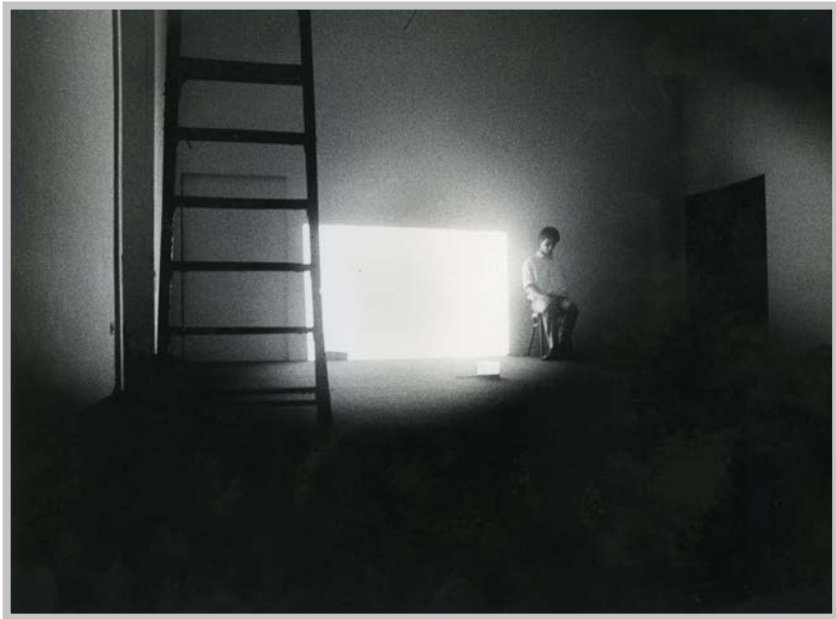
Falso Movimento, Segni di vita , Napoli, Galleria Lucio Amelio, 1979

Sia io che Angelo Curti invece eravamo più stanziali e molto legati alla frequentazione quasi