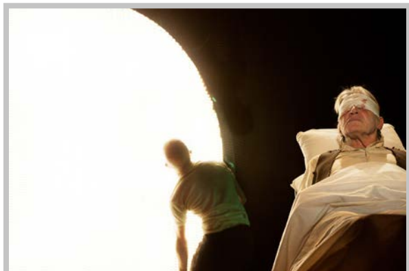
Serata a Colono , regia Mario Martone, 2013 ©Mario Spada