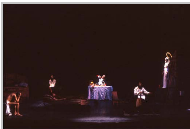
Falso Movimento, Rasoi, regia Mario Martone, 1991

C.G.: Sì, così recita il dizionario etimologico di Pianigiani; 12 un'apertura importante sulla natura del buio, che, mi scrivesti, ti ha richiamato la visione rossastra che compare chiudendo gli occhi al sole... Da quando ti conosco ritrovo questa tua inclinazione a vivere gli eventi naturali della luce, dell'ombra, del buio come materia prima, direi senza soluzione di continuità con quello che fai a teatro o al cinema.