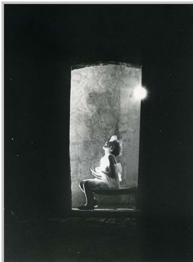
Falso Movimento, Otello , Napoli, Castel Sant'Elmo, regia Mario Martone, 1983

P.M.: Allora mi sembrava che Perlini facesse cose completamente diverse dalle nostre, invece questa citazione è un manifesto che sottoscriverei, che avrei sottoscritto avendolo conosciuto... «amo soprattutto il frammento» sicuramente rientra nel nostro approccio. L'analisi portava anche a elevare il frammento, il particolare a statura di 'Tutto', esaltando il fotogramma, l'inquadratura, la porzione di spazio che decidi di rendere visibile.