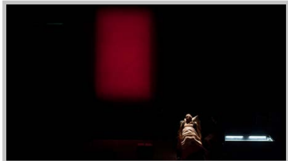
Serata a Colono , regia Mario Martone, 2013