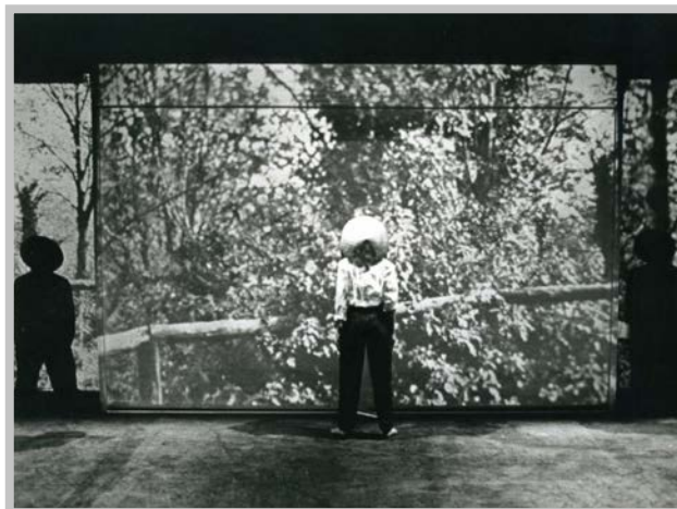
Falso Movimento, Tango glaciale , Napoli, Teatro Nuovo, 1982