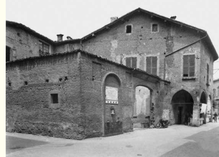
Porta Brennone, luogo dell'eccidio dopo la guerra