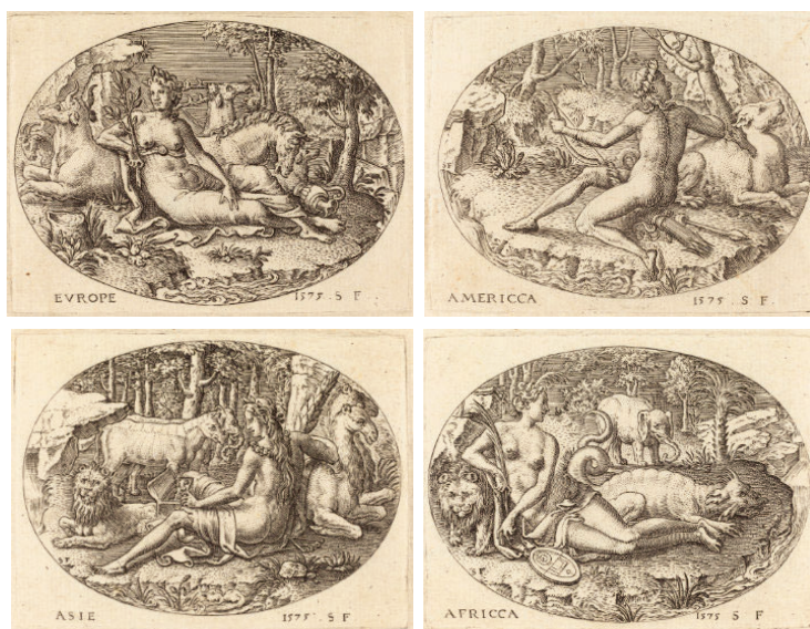
Etienne Delaune, Europe, America, Asia, Africa . National Gallery of Art, CCO, via Wikimedia Commons.

Etienne Delaune, orafo e incisore francese, nel 1575 produce quattro stampe con le rappresentazioni dei continenti con gli animali distintivi.