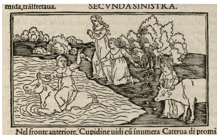
Da Hypnerotomachia Poliphili , Venezia: 1499, by Francesco Colonna. WKR 3.5.4, Houghton Library, Harvard University.

Ovidio Metamorphoseos vulgare è una pubblicazione dell'editore veneziano Lucantonio Giunta del 1497 e si tratta della traduzione in volgare, ad opera di Giovanni dei Bonsignori, della Expositio e delle Allegoriae dell'opera di Ovidio da parte di Giovanni del Virgilio, accolti però come una traduzione delle Metamorfosi . La pubblicazione è arricchita di incisioni acquarellate, e in particolare nel "Ratto di Europa" vengono accostati diversi momenti del racconto.