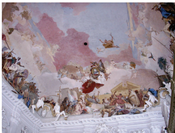
Giovanni Battista Tiepolo, Allegoria dei pianeti e dei continenti . This file is licensed under the Creative Commons Attribution-Share Alike 3.0 Unported licence.

A Würzburg Giambattista Tiepolo, sulla volta dello scalone della Residenza del principe-vescovo Carl Philipp von Graffenclau affresca nel 1752 un'Europa particolarmente altisonante, alle cui elevate virtù affianca il ritratto encomiastico del principe-vescovo stesso.