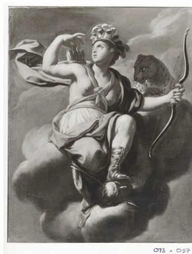
Francesco Trevisani, Allegoria dell'Africa, Allegoria dell'America , Galleria Nazionale d'Arte Antica di Palazzo Barberini, Roma. Catalogo Fondazione Zeri, Bologna.

A Würzburg Giambattista Tiepolo, sulla volta dello scalone della Residenza del principe-vescovo Carl Philipp von Graffenclau affresca nel 1752 un'Europa particolarmente altisonante, alle cui elevate virtù affianca il ritratto encomiastico del principe-vescovo stesso.