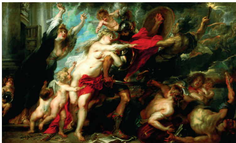
Peter Paul Rubens, Consequenze della guerra , Galleria Palatina, Firenze.

Come ultimo spunto, vale la pena precisare che le esplorazioni che dal XVII secolo si spinsero verso la Tasmania non ebbero alcun impatto sulla sensibilità iconografica nei confronti dei continenti. L'equilibrio quadripartito ormai consolidato non avrebbe potuto essere sconvolto dal quinto continente australiano.