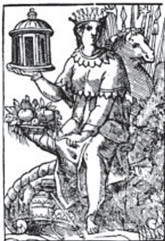
Cesare Ripa incisore Europa Iconologia, Rome 1603.

Questa consuetudine si ritrova ancora nell'Ottocento, a opera della manifattura di Vienna, dove i continenti sono rappresentati in quattro statuette di porcellana. Il personaggio dell'Europa assume presto le sembianze di una sovrana, in virtù del papato, della dignità imperiale e del prestigio scientifico e artistico.