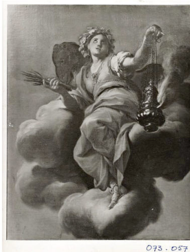
Francesco Trevisani, Allegoria dell'Europa, Allegoria dell'Asia , Galleria Nazionale d'Arte Antica di Palazzo Barberini, Roma. Catalogo Fondazione Zeri, Bologna.