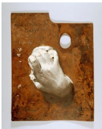
Fig. 9. Léon Bonnat, La mano di Antoine-Louis Barye , 1897, Baltimore, The Walters Art Museum.

In una delle due versioni del disegno, un'annotazione sul foglio spiega che l'immagine è stata fatta dal pittore, steso sul letto, appoggiando la mano sinistra sul foglio bianco e ripassando i bordi a matita. 23