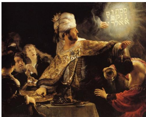
Fig. 2. Rembrandt Harmensz van Rijn, Il festino de Baldassarre , 1639 ca, olio su tela, 167×209 cm, London, National Gallery.

L'apparizione misteriosa della mano di Dio richiama alla mente l'episodio biblico ( Dn 5:1-31) del Festino di Baldassarre : illustrato da Rembrandt, intorno al 1639, in un dipinto oggi conservato a Londra [fig. 2]. Nel racconto biblico tutto comincia con un sontuoso banchetto nel palazzo di Baldassarre, l'ultimo re babilonese.