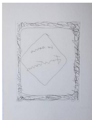
Fig. 11. Lucio Fontana, Io sono Fontana , 1966, acquaforte 56/99, 19,7x15,8 cm, Locarno, collezione Rezzonico.

Il lavoro dell'artista tedesca Katharina Hinsberg intitolato Di-segno , del 2006, 26 mostra la sua mano destra, o per essere più precisi un prolungamento posticcio del suo dito indice, mentre traccia una linea su un foglio bianco [fig. 10]. In questo caso il segno grafico è fisicamente un'estensione della mano dell'artista, determinando la continuità tra gesto e segno e soprattutto la coincidenza tra artista e opera. Sorprendentemente la mano della Hinsberg ricorda da vicino quella dipinta alcuni secoli prima da Ribera, quella mano misteriosa che traccia alcuni segni indecifrabili sulla parete. Sembra davvero possibile che esista un modello comune, una figura iniziale; un simbolo che nel tempo si è progressivamente scarnificato, fino a diventare segno. Per citare André Chastel: "attraverso una degradazione progressiva, che più che una deriva semantica riflette una sorta di usura di autoconsunzione del simbolo, [...] il segno del mistero, impregnandosi di ciò che è implicito, diviene, assorbe e sprigiona il mistero del segno" (2001, 87-88). Scarnificata, ma non depotenziata, la forma ottiene, impregnandosi di ciò che è implicito, una grande forza espressiva.