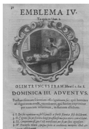
Fig. 1. Engelgrave, 1655, 32.

Il linguaggio artistico, pur modificandosi continuamente in funzione del tempo e del luogo che lo esprime, sembra, tuttavia, contenere alcune immagini ricorrenti. Sono quelle forme archetipiche per le quali Warburg ha coniato l'espressione Pathosformeln 1 : fermi-immagine che hanno una specificità morfologica. Tra queste, si può annoverare la mano d'artista, una mano che ritratta da sola rappresenta un'eccezionale metonimia visuale (Chastel 2001, 30).