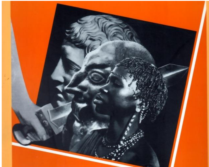
Ill. 1. La difesa della razza I/1 (1938), cover.

Mussolini's bombastic mottoes: "È l'aratro che traccia il solco, è la spada che lo difende" (the plough traces the furrow, the sword defends it). 11