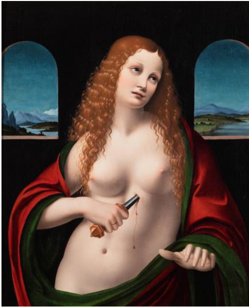
Fig. 7. Marco d'Oggiono, Suicide of Lucretia romana , private collection.

is not so much simply engulfed by theory as made functional to a theoretical understanding of that work. (2010, 19) 4