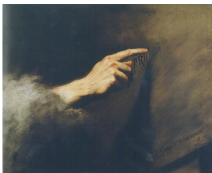
Fig. 3. Jusepe de Ribera, La visione di Baldassarre , 1635, olio su tela, 52×64 cm, Milano, Galleria Arcivescovile.

riceve con gratitudine il dono del caso, e lo mette rispettosamente in evidenza. Gli proviene da un dio, e così è anche per la causalità che è frutto della sua mano. Se ne appropria senza esitare, e fa nascere qualche nuovo sogno. È un prestidigitatore (mi piace questa vecchia parola, così lunga) capace di trarre partito dai suoi errori, dalle sue prese mancate, per farne giochi nuovi. 7