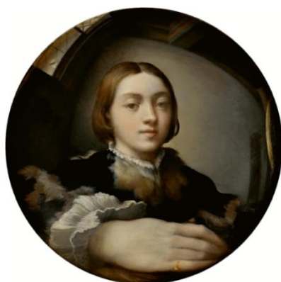
Fig. 4. Parmigianino, Autoritratto entro uno specchio convesso , 1524 ca., olio su tavola, 24,4 × 24,4 cm, Wien, Kunsthistorisches Museum.

Rendendo presente il pittore assente, come in un fuori campo cinematografico, la mano mette in scena la reversibilità visiva del quadro, che determina l'azione del vedere e quella dell'essere visti, e segnala il complesso gioco della pittura. Avvolta da una nube, al centro di un'inquadratura stretta che la fa apparire quasi amputata, più simile a uno studio anatomico che a una mano viva, la mano di Ribera sarebbe, dunque, una metafora pittorica. D'altronde, proprio questa mano che incide su una parete dei segni illeggibili, di una scrittura muta, unicamente visiva, i contemporanei del pittore spagnolo ritenevano di riconoscere la mano dell'artista: la sua pars pro toto 11 . Ribera ha così trasformato una teofania in un'epifania pittorica, facendo del pubblico il testimone oculare dell'apparizione. L'ombra sul muro aumenta l'impressione di una presenza fisica immanente e l'effetto richiama ancora alla memoria la figura del pittore prestidigitatore e le parole di Focillon che, sempre nell' Éloge de la main , osserva come l'arte sia anche negromanzia , l'arte che si decifra "sulle pietre, nello sciabordio delle onde, sulle ali degli uccelli, nei segni scritti da mani che non si vedono" (Focillon 2002, 123).