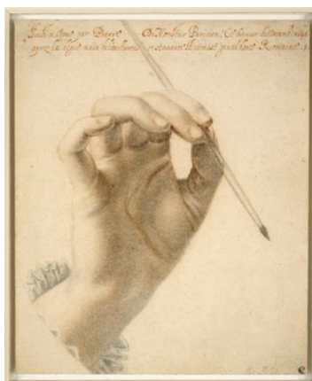
Fig. 6. Pierre Dumonstier, Mano destra di Artemisia Gentileschi che tiene un pennello , 1625, carboncino e sanguigna, 21,9×18 cm, London, British Museum.

Il volto di Artemisia si sovrappone, dunque, all'emblema della pittura. Se l'autoritratto richiede uno specchio e alcune pazienti sedute di posa, il ritratto di Londra accelera il discorso simbolico, creando una perfetta identità tra mito e realtà. Artemisia si ritrae con il braccio teso sulla tela vuota e il pennello nella mano, assorta nel momento dell'inizio di un lavoro: tutti i pensieri che l'attraversano sembrano presenti in quella mano che sta per creare. Il ritratto di un pittore che dipinge è di per sé una tautologia, se poi si tratta, come in questo caso, di un autoritratto, la mise en abyme è quasi inevitabile.