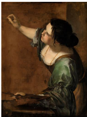
Fig. 5. Artemisia Gentileschi, Autoritratto come allegoria della Pittura , 1638-1639, olio su tela, 98,6 × 75,2 cm, Royal Collection, London, Kensington Palace.

ingigantita dal riflesso dello specchio non coincide con il naturale, ma è proprio quella mano che sancisce il primato della pittura: una pittura che, con piena consapevolezza, mette in scena il proprio potere illusivo. 14 D'altro canto, l'accento posto sulla mano d'artista è sintomo di una sensibilità nuova. 15 Se il Rinascimento aveva rivendicato la componente intellettuale del mestiere dell'artista, nella seconda metà del Cinquecento la mano del pittore e, quindi, il lavoro manuale erano stati rivalutati dai trattatisti come dai pittori. 16