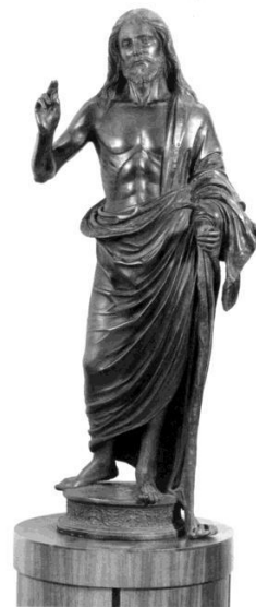
Fig. 3. Follower of Pietro Lombardo (?), The Redeemer , bronze, Milan, Poldi Pezzoli Museum.