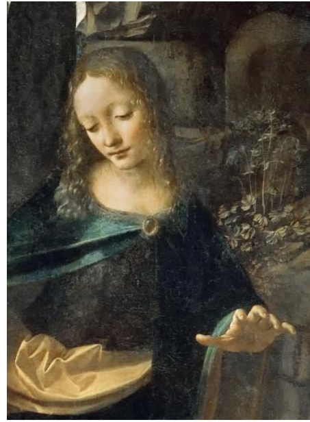
Fig. 6. Leonardo da Vinci, Virgin of the Rocks , Paris, Musée du Louvre, detail.

The observation of paintings as suggested by Wind, with special attention given to the question of the “model”, sometimes allows one to read the gestures of certain painted figures as the esthetic-compositional “solution” found by artists to make such figures perform a symbolic function appropriate to the pedagogical and moral character of the whole image. For example, in a recent study (Rossi 2020) of a privately-owned Suicide of Lucretia painted in about 1506 by Marco d'Oggiono, a pupil and collaborator of Leonardo da Vinci [fig. 6], it was possible to detach the gesture of the Roman heroine – that of the “mano a cupola” (domed hand), morphologically resembling that of Mary in the Virgin of the Rocks by Leonardo [in both versions, Paris and London; fig. 7] – from its quality as nothing more than perspectival bravura or a simple citation from the great master, and thus a mere reproduction of a known model. A reconstruction of the painting's possible origins as a wedding gift for a bride who bore the same name as the ancient heroine, Lucrezia Franciotti Della Rovere (wife of Marcantonio Colonna and niece of Pope Julius II, an historically documented patron of Marco d'Oggiono) allowed the “mano a cupola” gesture to be understood as the “solution given” to the “problem posed” by the composition itself to