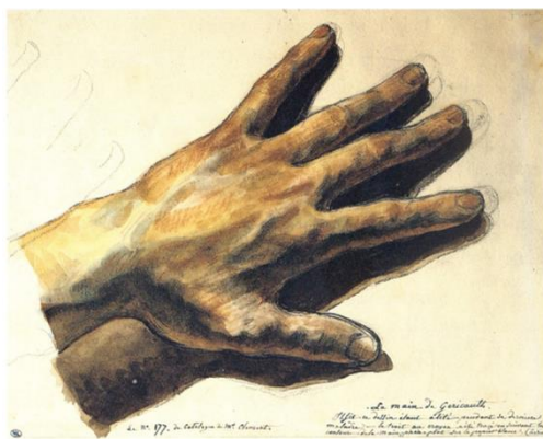
Fig. 8. Théodore Géricault, La mano sinistra dell'artista , 1823, disegno acquerellato su carta, Paris, Louvre.

L'immagine, in un gioco di rovesciamenti, racconta la complessa identità dell'artista: il suo essere figura da ritrarre e, al contempo, esecutore del ritratto. Lo specchio permette di guardarsi dall'esterno, anche se nell'immagine assistiamo a uno scrutarsi all'interno. Il pittore esamina la propria mano, osservandone con attenzione l'indice: è il dito che giudica e, in questo caso, è puntato proprio sulla scritta che svela il nome dell'artista. In fondo, come osserva Pascal Bonafoux, dipingere il proprio autoritratto è affermare una presenza hic et nunc e tale presenza è tanto dell'opera, quanto dell'artista. 21 Tuttavia, rivendicando il potere demiurgico dell'artista, può accadere che, in questo processo di divinizzazione, la mano dell'artista diventi una reliquia.