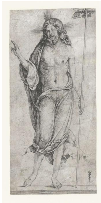
Fig. 5. Jacopo de' Barbari, The Risen Christ , engraving.

Thus, bearing in mind what we have stated so far, there are not enough elements to consider a close relation between Carpaccio's Risen Christ and the bronze in the Poldi Pezzoli Museum, nor can any such relation exist between the painted Christ and the lost figure mentioned in the sources. Consequently, we cannot find ourselves in agreement with the creation of a theory of anachronic images based on this specific case, even beyond the wealth of reflections that might be prompted by the theory in and of itself. Carpaccio's Risen Christ was probably based on other models. Indeed, there were numerous engravings circulating in Venice during the period in which he painted the Vision of Saint Augustine , for instance, the Risen Christ signed by Jacopo de' Barbari (with his customary caduceus) and datable to circa 1498 [fig. 5] (Ferrari 2006, 119-120).