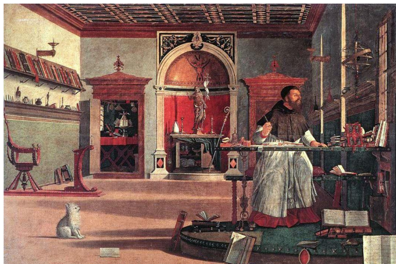
Fig. 1. Vittore Carpaccio, Vision of Saint Augustine , Venice, Confraternity of San Giorgio degli Schiavoni.

This study addresses the reflections prompted by a painting by Vittore Carpaccio as studied by two American art historians, Alexander Nagel and Christopher S. Wood, the authors of a controversial article titled “Toward a New Model of Renaissance Anachronism” (2005; developed into a book in 2010). 2 The two scholars construct a fascinating theory of anachrony in Renaissance art, although – in our opinion – this is founded on faulty observation, and thus in the mistaken interpretation of the specific object in their analysis; the conception of their theory is therefore based on empirical data that fails to stand up to careful formal verification. Nagel and Wood focus their attention on the pictorial representation of the sculpture of Christ the Redeemer in the background of Carpaccio’s celebrated Vision of Saint Augustine (Venice, Confraternity of San Giorgio degli Schiavoni), painted between 1502 and 1503 [fig. 1].