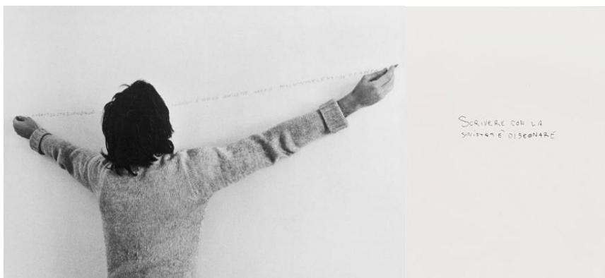
Figg. 12 e 13. Alighiero Boetti, Oggi è venerdì ventisette marzo millenovecentosettanta , 1970.

Negli anni Sessanta, l'immagine tautologica della mano del pittore che dipinge si rivela in tutta la sua complessità, problematizzando, di fatto, il ruolo dell'artista e, come recita il titolo di una conferenza di quegli anni di Michel Foucault, obbligando ad interrogarsi su Qu'est-ce-qu'un auteur ? (1969).