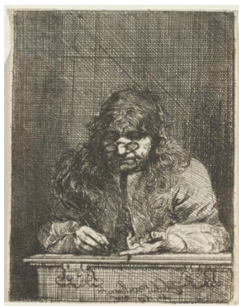
Fig. 7. Michael Willmann, Autoritratto dell'artista che disegna la propria mano , 1675, incisione su carta, 10,7×8,20 cm, Washington, National Gallery of Art.

Gli esempi fin qui proposti sono un piccolo saggio di un ricco repertorio, dal momento che, raccontata in prima persona o rappresentata da altri, la mano artista è un tema persistente. D'altro canto, per un artista, ritrarre la propria mano vuol dire manifestare una coscienza teorica. Osservare la propria mano è guardare dentro di sé: esaminare da vicino il proprio strumento di lavoro, interrogarsi sulla propria identità.