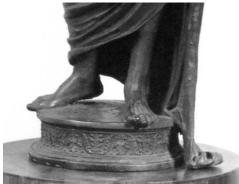
Fig. 4. Follower of Pietro Lombardo (?), The Redeemer , bronze, Milan, Poldi Pezzoli Museum, detail of the base.

of the ancient sculpture and its modern “substitution”. According to Nagel and Wood, the foliate decoration encircling the round base of the bronze represents the miracle described in the early source: when Christ’s mantle touched the arid ground, it made it suddenly blossom (414 note 16). Why, then, did Carpaccio totally revise the type of base of his presumed model, not reproducing the vegetal ornament that was so important for the iconographic recognition of its very model? Moreover, this decoration, identified as illustrating a specific miraculous episode, could instead be a typical foliate motif with stylized palmettes, without any particular iconographical meaning, as Charles Dempsey has already suggested (2005, 417). Having noticed this inconsistency, the two scholars settle the question in a note to their article: “He [Carpaccio] missed, however, the telling detail of the drooping hem. The statue clearly carried authority for him without the support of ‘philological’ clues such as this” (414 note 24). In their response to Dempsey’s critique, Nagel and Wood further insist on the point that there was no need for philological support for the recognition of the “substitution” (2005a, 431). The point – in our opinion – is that what is lacking here is not only philological support but also the minimal, necessary morphological one, so that the phenomenon of substitution can be hypothesized.