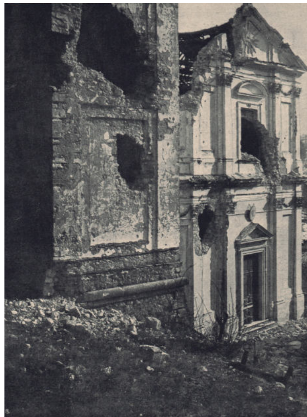
Fig. 01 - Chiesa Parrocchiale a Velo d'Astico: Danni di guerra. Dal libro U. Ojetti - I monumenti italiani e la guerra . Milano: Alfieri e Lacroix, 1917.

solo così si riconduce l'arte tra il popolo con qualcosa di meglio delle conferenze e delle proiezioni; solo così si prova che l'arte dev'essere mescolata alla nostra vita [...]” (Ojetti, 1919b).