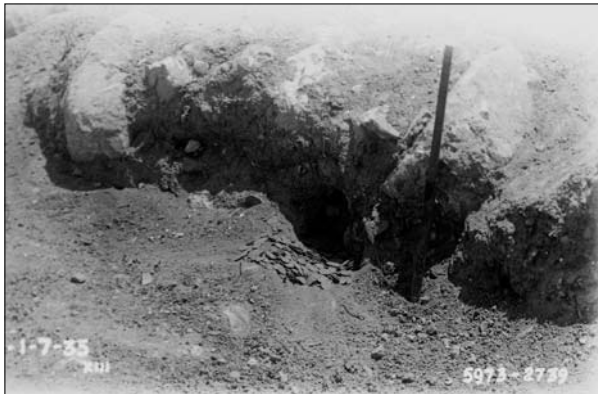
Fig. 7. Foto del momento del rinvenimento di un gruzzolo di monete di bronzo tardo imperiali dall'area del Cesareo di Cirene 1935 (particolare).

D'altro canto, le foto d'archivio ci illuminano anche su vicende complesse che interessano aspetti numismatici, ma che hanno a che fare soprattutto con la storia delle fasi tardoantiche di Cirene e della Cirenaica. In questo contesto va innanzi tutto precisato come molta letteratura archeologica ritenga che queste due realtà, dopo un periodo relativamente florido, che abbraccia i primi secoli dell'età imperiale, siano andate incontro a una decadenza, aggravata da un evento sismico di cui restano tracce evidenti nei crolli degli edifici in tutta la regione e che si fa tendenzialmente coincidere con il terremoto del 21 luglio del 365 d.C. 12 . Purtroppo le attività archeologiche che sono state condotte dagli Italiani a partire dal 1913 e anche da altre missioni internazionali nel secondo dopoguerra hanno privilegiato nei contesti urbani l'indagine e la ricostruzione di edifici monumentali sacri e civili 13 , con un approccio certamente non stratigrafico che ha di fatto eliminato pressoché ovunque le stratigrafie più recenti, peraltro spesso già gravemente intaccate dall'attività agricola: questo ha comportato, per esempio, che le testimonianze monetali riferibili alle fasi successive al 365 d.C., che pure sussistono 14 , quasi mai possono essere d'aiuto nell'indagine archeologica.