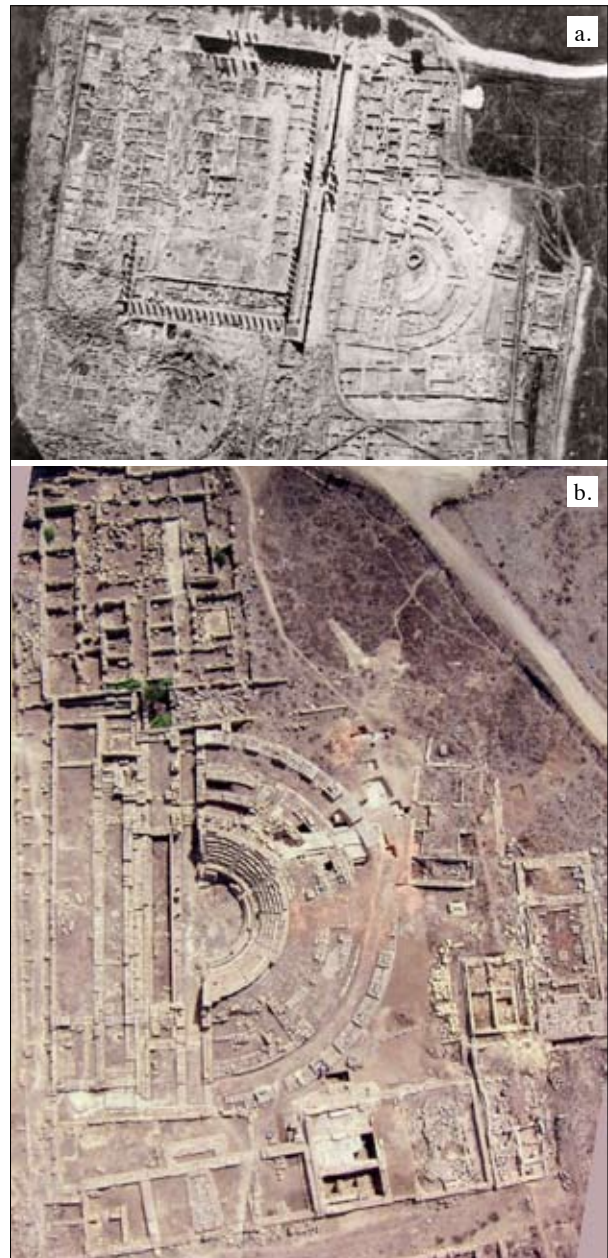
Fig. 8. a. Foto aerea degli anni '30 del Novecento raffigurante a sinistra il Ginnasio ellenistico/Caesareum e la Basilica, entro i quali sono ancora visibili in situ le case tardo-antiche, poi smantellate; immediatamente al di sotto, il Teatro 2/Odeion; a destra (i.e. a sud) il Teatro 3, nonché il Tempio di Cibele e la "Casa del Ripostiglio", entrambi coperti dai binari della decauville; b. foto aerea dell'area del Teatro 3 di Cirene (2009): a destra, dislocati l'uno di seguito all'altro, il Tempio di Cibele e la "Casa del Ripostiglio" in corso di scavo (sono visibili le tracce della massciata della Decauville).

l'area archeologica (figg. 8a, 9). Una di queste è da porsi nella fascia meridionale del Quartiere Centrale, a sud del Teatro 3. Lo scavo recente, che ha permesso di individuare il Tempio di Cibele, ha indagato pertanto anche gli strati di crollo dell'edificio (fig. 8b), con il conseguente rinvenimento di circa 15 monete di metà-seconda metà del IV secolo 15 . La più tarda