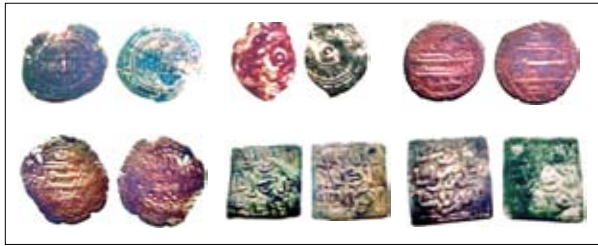
Fig. 6. Monete islamiche trafugate dalla Banca Commerciale di Bengasi nel febbraio 2011 (fonte v. nota 7).