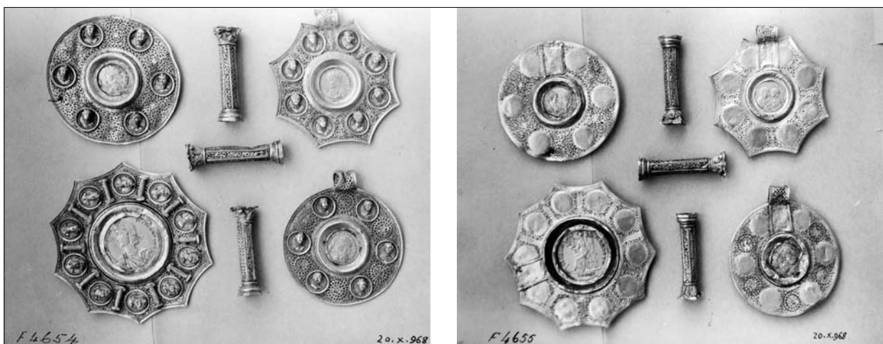
Fig. 10. Foto dei pendenti aurei con medaglione centrale e dei tre distanziatori a forma di colonna corinzia rinvenuti nel 1968 a Sidi bu Zeid, presso Barce, e ancora conservati in Cirenaica (2010).

Tuttavia, l'acquisizione più significativa è data dalla ricostruzione ideale della situazione iniziale del gruzzolo di provenienza, costituito da 430 solidi, da una collana aurea con nove pendagli e otto distanziatori a colonna corinzia, da un bracciale aureo con pietre dure e, infine da alcuni elementi di un'altra collana aurea con perle e pietre dure. Si tratta di uno dei più imponenti tesori della tarda antichità nel Mediterraneo, contenente uno dei più sontuosi capolavori della storia della gioielleria d'epoca imperiale, in origine del peso di 2,5/3 libbre romane e della lunghezza di circa cm 90: la datazione dell'interamento va fissata attorno al 390 d.C. e potrebbe coincidere con la data del terremoto di cui sopra, anche se nulla è dato sapere sulle circostanze del nascondimento. Scavi condotti presumibilmente in seguito alla scoperta di parte del gruzzolo hanno individuato probabilmente la parte produttiva di una villa fortificata