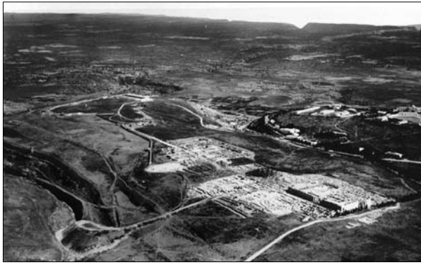
Fig. 9. Foto aerea degli anni '30 del Novecento raffigurante le aree archeologiche del Ginnasio ellenistico/Caesareum, del Quartiere centrale e del'Agorà di Cirene: a sinistra (i.e. a sud) del Cesareum si distingue il Teatro 3, nei cui pressi è visibile la massicciata della Decaeville che ricopre le strutture del Tempio di Cibele e della "Casa del Ripostiglio"; ancora più a sud, la zona di scarico della Decaeville.

di queste è un AE2 di Valentiniano II databile al 378-383 d.C. 16 e permette di datare il crollo agli ultimi due decenni del secolo e dunque di collocare in questa fase l'evento sismico che ha coinvolto Cirene e la Cirenaica. Tale eventualità, già altrimenti ventilata su altre basi 17 , trova peraltro il conforto di quanto emerso dallo scavo della Tomba C di Ain Hofra 18 .