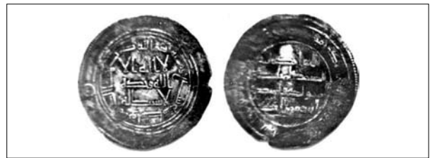
Fig. 5. Omayyadi, Hisham ibn Abd al-Malik (H 105-126/AD 724-743), dirham, H 107/AD 725-726, zecca di Wasit, WALKER 1956, n. 554 e KLAT 2002, n. 700.

Non c'è da stupirsi pertanto se una parte non irrilevante dei rinvenimenti di moneta aurea d'epoca greca è testimoniata solo da foto d'archivio: di fatto tre (figg. 1, 3-4) dei sei stateri, della cui provenienza locale si è certi, sono documentati in questo modo, così come una frazione aurea (fig. 2) 4 . In realtà,