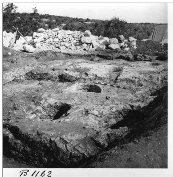
Fig. 12. Foto del 1968 relativa all'area indagata archeologicamente in seguito al rinvenimento dei pendenti aurei e dei solidi presso Sidi bu Zeid (Barce).

La ricostruzione del ripostiglio e del possibile contesto di provenienza gettano nuova luce sulla Cirenaica tardo antica a prescindere dal momento in cui va collocato il sisma, con l'attestazione di un livello di ricchezza piuttosto considerevole. Contestualmente, con lo spostamento in basso della datazione di questo evento, la nutrita presenza di gruzzoli di IV secolo inoltrato in un'area circoscritta di Cirene (Agorà/Cesareo/Quartiere centrale) 23 , dove in questo periodo plausibilmente s'installano attività artigianali 24 , più che essere sintomo di degrado va spiegata nel contesto di una evidente dinamicità economica che male si concilia con il quadro depresso prospettato nelle fasi tardo antiche per Cirene e tutta la regione cui diede il nome. Tali ricchezza e dinamicità furono forse in grado di contrastare i danni derivanti dal terremoto della fine del IV secolo e dalle successive invasioni degli Austuriani e dei Mazikes d'inizio V 25 e potrebbero essere almeno in parte lo specchio delle profonde ristrutturazioni dei centri urbani cirenaici, e prima di tutto di Cirene