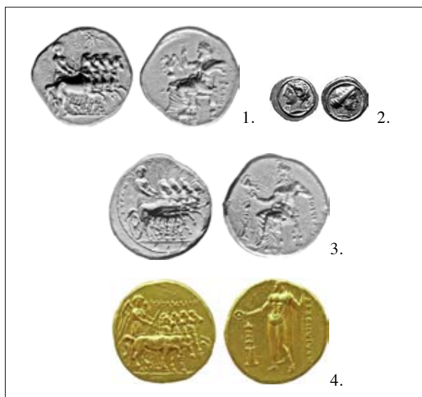
Figg. 1-4. 1. Iason , 331-322 a.C., statere, NAVILLE 1951, n. 26; 2. Theu(pheides) , 331-322 a.C., litra, NAVILLE 1951, n. 49; 3. Chairis , 322-313 a.C., statere, NAVILLE 1951, n. 80; 4. Polianthes , 312-310 a.C., statere, NAVILLE 1951, n. 134.

In questo scenario le indagini numismatiche nate dalla collaborazione con la Missione Archeologica Italiana dell'Università di Urbino, già diretta dal compianto Mario Luni, hanno condotto all'individuazione anche di varie foto presso l'Archivio Fotografico del Dipartimento per le Antichità di Cirene (DAC), le quali da un lato arricchiscono in maniera non banale il quadro dei rinvenimenti monetali d'epoca antica e medievale pertinenti alla regione nord-africana e dall'altro illuminano su alcune vicende che hanno caratterizzato la storia di Cirene e della Cirenaica tutta. Le quantità certamente considerevoli di monete che nel corso del tempo sono emerse dalle indagini archeologiche ivi condotte raramente, infatti, sono state considerate degne di essere documentate fotograficamente 3 , se non nel caso in cui si trattasse di esemplari o ritrovamenti eccezionali, cosicché le rare foto di monete di fatto interessano categorie di