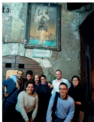
Fig. 3: (A) Logo del gruppo italiano ECHN; (B) Il nucleo fondatore di ECHN-Italy in occasione del convegno FLOWPATH 2014 (Viterbo).