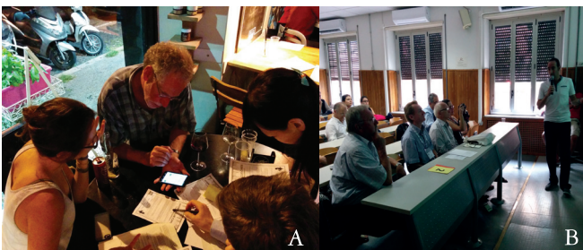
Fig. 1: (A) ECHN Social Function and (B) la presentazione del vincitore del Coolest Paper Award 2015 durante il convegno AQUA 2015 (Roma).

È stato creato in territorio italiano un gruppo di riferimento per la condivisione e promozione di iniziative rivolte a chi desidera confrontarsi con altri colleghi all'inizio della loro carriera professionale o accademica su problematiche idrogeologiche, gestione delle risorse idriche e possibilità di lavoro.