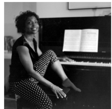
Figg. 2a, 2b, 2c e 2d, Lorna Simpson, May/June/July/August 1957/2009 , 2009, immagini della mostra Lorna Simpson: Gathered , 2011, New York, Brooklyn Museum

(le immagini sono tratte dal sito: http://www.brooklynmuseum.org/exhibitions/lorna_simpson/ ).