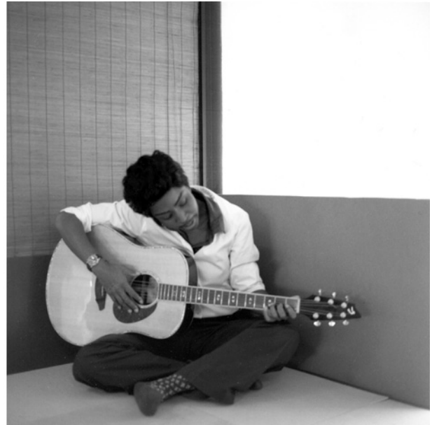
Figg. 3 a-b, Lorna Simpson, Interiors 1957/2009 , 2009, immagini della mostra Lorna Simpson: Gathered , 2011, New York, Brooklyn Museum