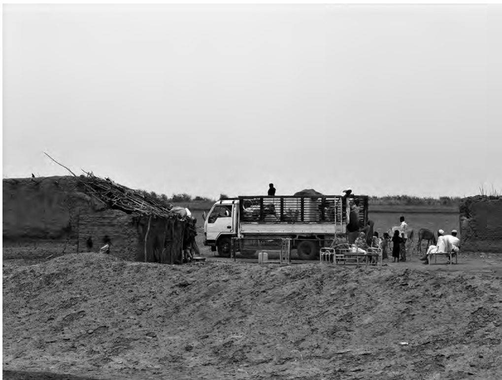
Fig. 3 – Villaggio di Elfirai, WNSC. Evacuazione dovuta all'ampliamento del perimetro agricolo.

di Togaba e di Higra, nell'area della Kenana. Un altro vantaggio è la rete di strade interne al progetto e, per i perimetri più lontani, l'allacciamento alle principali vie di comunicazione. Questi aspetti indubbiamente rappresentano elementi positivi che la presenza delle società attiva in ambito locale.