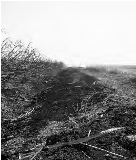
Fig. 4 – Campi ancora fumanti ad avvenuta raccolta della canna da zucchero, Sennar.

Un altro problema di grande rilevanza che gli abitanti sottolineano con forza è l'impatto ambientale della produzione dello zucchero. Effetti negativi si registrano tanto per l'inquinamento dell'aria come per quello dell'acqua. La modalità attuale di raccolta della canna prevede di bruciare i campi prima di passare con le macchine o di raccogliere manualmente: in tal modo si eliminano le foglie e si preparano i fusti di canna per il successivo trattamento, oltre a scacciare eventuali presenze in-