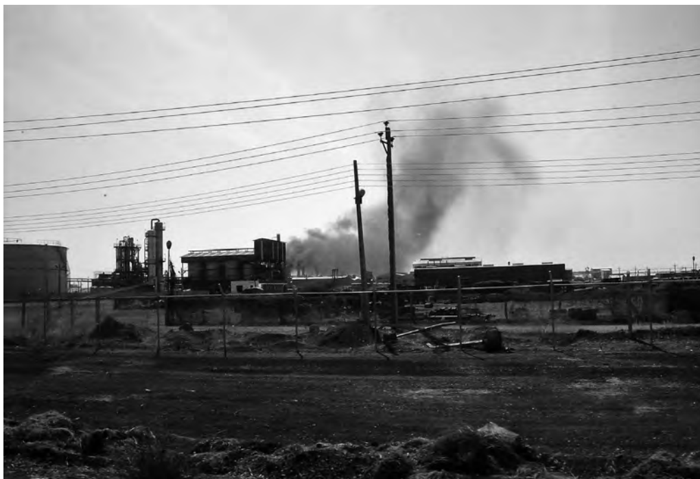
Fig. 5 – Zuccherificio della Kenana, in funzione.

Nei villaggi visitati dei diversi perimetri si registrano problemi d’asma e infezioni agli occhi. A Wad Alsyed, centro posto immediatamente a Sud dello zuccherificio di Gunied, alcune persone hanno abbandonato le case per colpa delle ricadute dei residui della bagassa bruciata. Durante il periodo di attività dello zuccherificio, da novembre a maggio, filamenti combusti e polveri nere ricoprono tutto ed entrano in ogni ambiente. Molti cittadini sono colpiti, alle volte severamente, da malattie correlate con questo inquinamento. Bisognerebbe attrezzare le ciminiere con filtri adeguati, ma l’intervento è considerato troppo costoso dalla società. Da parte di alcuni gruppi di attivisti sono state fatte proteste pacifiche con slogan come “Enough! Enough! Enough!” e “We are humans”. Una attivista ha affermato: “Sappiamo anche noi che è possibile bloccare le bagasse, per questo loro [i dirigenti della società] devono procedere in questa direzione. Certamente costa. Ma la vita umana è più importante della produzione industriale” (intervista rilasciata il 2/06/2016). Le manifestazioni hanno avuto visibilità sui media nazionali. In generale, gli abitanti dei villaggi colpiti capiscono la pericolosità del ciclo produttivo ma hanno ben presente l’importanza dello zuccherificio, anche per l’economia dell’area. Vi è quindi chi cerca soluzioni concertative con la società, nella direzione ad esempio di aumentare i servizi sanitari.