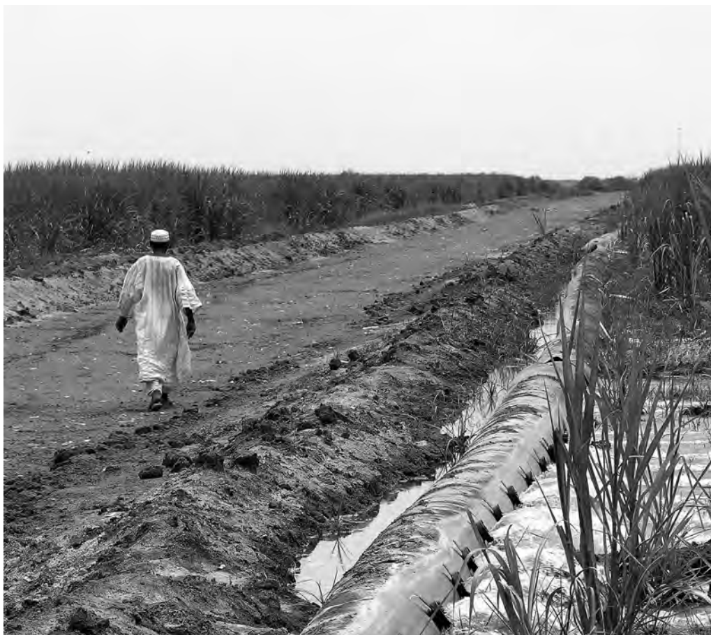
Fig. 2 – La tecnica irrigua dell' hydroflow , Wnsc

sta tecnica è diffusa al 95% e nel Wnsc è l'unica utilizzata. I vantaggi di questa costosa tecnologia sono molti. Essa permette di recuperare spazio (al posto dei canali e delle arginature c'è il tubo in plastica), di ridurre il tempo di lavoro per la costruzione e la manutenzione dei canali di campagna, di risparmiare acqua (le perdite per infiltrazione sono ridotte e così anche l'evaporazione), di evitare la proliferazione di erbe infestanti e di ridurre le pratiche di diserbo (e quindi la forza lavoro), di contrastare la proliferazione delle zanzare e di conseguenza l'impatto della malaria. Al contrario nei perimetri della Ssc, l'uso dell' hydroflow è molto ridotto, non solo per il costo dei tubi ma anche perché richiede un preciso livellamento dei terreni, da effettuare con tecnologia al laser, e una manutenzione continua: procedure troppo dispendiose per i bilanci pubblici.