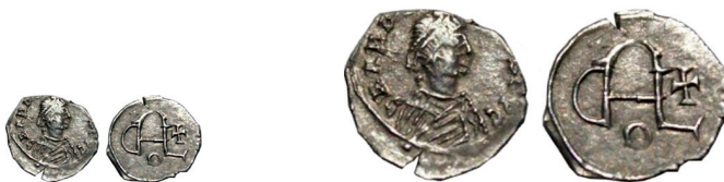
Figuer 31-32. C.s.