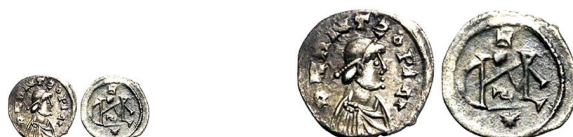
Figure 11-12. Argenteo con «monogramma di Odoacre» (Jean Elsen & ses Fils S.A., Auction 134, 9 September 2017, lotto n. 975), con riproduzione in scala doppia