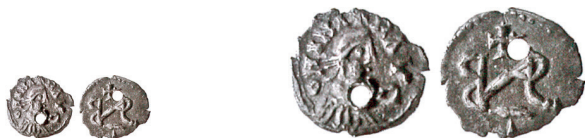
Figure 15-16. Argenteo con monogramma di Gundobad, rinvenuto a Calaincourt (Aisne) (Foucray 2004, n. 1), con riproduzione in scala doppia

D'altro canto, la possibilità che si tratti di Odoacre sembrerebbe essere esclusa dal fatto che, negli esemplari in cui la relativa porzione del campo è visibile, compare leggibile un'asta inclinata ai piedi del montante verticale della lettera R, la quale indica la presenza di una lettera L. Questo dettaglio, impossibile da cogliere sull'esemplare mutilo edito da Lagoy, ricade nella porzione mancante del tondello anche del pezzo illustrato sul forum OMNI; sui