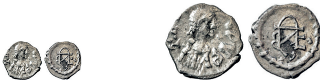
Figure 27-28. Argenteo con monogramma di Teodebaldo (Adam 2018), con riproduzione in scala doppia