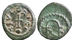
Figura 17. Moneta di bronzo con monogramma di Teodorico I

Senza avere la pretesa di dare uno scioglimento definitivo dell'enigma, non si può fare a meno di evidenziare come tutte le lettere su indicate coincidano sostanzialmente con quelle che compongono il nome di Clotario, nella versione latinizzata del nome Chlothacharius o Chlothaharius ( PLRE , II: Chlothacharius ): C L O A R (o ʝ) I V ʒ 12 . Risulterebbero assenti le lettere H e T e dunque quelle presenti rinvierebbero a forme semplificate del nome, ossia a C(h)lo(th)ac(h)arius o C(h)lo(th)a(h)arius.