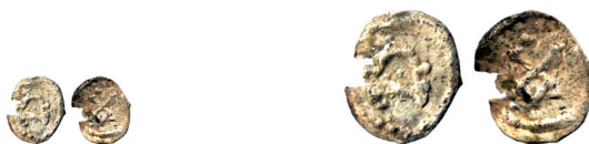
Figure 18-19. Argenteo con monogramma di Teodeberto al dritto e monogramma di Massalia (Schiesser e Vandenbossche 2014a), con riproduzione in scala doppia

della lettera H per Teodorico I ( MEC , 1: n. 388) (fig. 17), per Teodeberto (Schiesser 2018: IIB Type 2; Schiesser e Vandenbossche 2014a: fig. 8 = Schiesser 2018: IIB Type 3) (figg. 18-21) e per Teodebaldo 13 (figg. 25-28), fatti solo di consonanti e privi dell'H per Teodeberto (Schiesser 2018: IIB Type 1 e IIIB) (figg. 22-24), abbreviati per Clodoveo o per Clodemiro (Schiesser e Vandenbossche 2014b: fig. 8) (figg. 25-34). D'altro canto, se di Clotario esiste un'emissione argentea di «stile ostrogoto» con legenda D N CHLOTHAHARIVS REX 14 (fig. 35), ne esiste anche un'altra di «stile franco» con legenda D N CLOT[---]II (Lafaurie e Pilet-Limière 2003: 13.55.6.10). In buona sostanza, l'epigrafia dei nomi regali sulle monete franche è piuttosto disomogenea tra la fine del v e la metà del vi secolo e dunque il monogramma già ascritto a Odoacre potrebbe essere compreso in un quadro così definito. In questo caso anche la tradizionale lettura delle legende dei dritti (D N ANA..., ANANT?..A... o ΔNANT?..A..., D N ANT?Δ PI AI, D N ANAT..., D N...), con riferimento ad Anastasio, troverebbe giustificazione sia intendendo queste produzioni coeve con quell'augusto, sia ammettendo che possano essere intenzionalmente postume.