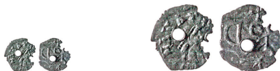
Figure 9-10. Argenteo con «monogramma di Odoacre», rinvenuto a Calaincourt (Aisne) (Foucray 2004: n. 2), con riproduzione in scala doppia