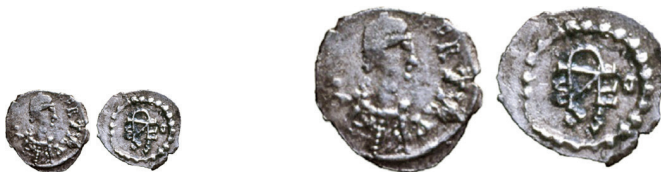
Figure 25-26. Argenteo con monogramma di Teodebaldo (Schiesser 2018), con riproduzione in scala doppia