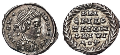
Figura 35. «Mezza siliqua» di stile ostrogoto a nome di Clotario (Bibliothèque nationale de France, Paris, Cabinet des médailles, gallica.bnf.fr), in scala doppia

D'altro canto, il peso di queste monete (0,17; 0,16; 0,15, mutilo; 0,08 bucato) rientra nella categoria dei cosiddetti minuti argentei (MEC, 1: 105, 111; Rovelli 2018: 78, 85), la quale se trova numerosi risconti nella monetazione di ambiente gallico di matrice franca 15 , burgunda (Lafaurie 1964: 189; Lafaurie 1992: 204-205; Foucray 2004: 43-44; Schiesser 2018: 71-72) e anche visigota (De Crusafont et al. 2016), risulta del tutto estranea all'esperienza monetaria argentea italica della fine dell'età antica o dell'inizio dell'epoca medievale, a prescindere dalla pertinenza produttiva: i tagli argentei di peso minore (c.d. «mezze silique») conati nelle zecche della Penisola non scendono al di sotto di g 0,70 nella seconda metà del v secolo 16 ; in particolare, le monete d'argento coniate per Zenone a Mediolanum o a Ravenna, infatti, rispondono a un peso medio di g 0,90 (RIC, X: 217; Grierson e Mays 1992: 38, tabella B), mentre degli esemplari ravennati con «monogramma di Odoacre» quello a Berlino pesa g 0,89 (fig. 1) e quello conservato al British Museum raggiunge g 0,82 (fig. 2); le monete di taglio minore riferibili alla serie ostrogota si aggirano attorno a g 0,7/0,6 (COI, 56-60); anche le coniazioni pseudoimperiali più leggere di matrice longobarda, realizzate in Italia settentrionale nel corso della seconda metà del vi secolo, si situano su un peso poco più elevato, ossia su g 0,2/0,25 (cfr. Asolati 2019).