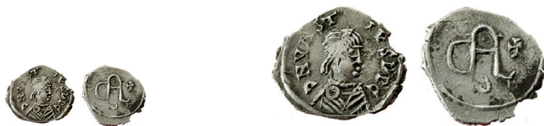
Figure 33-34. C.s. (Schiesser 2018)

D'altro canto, il peso di queste monete (0,17; 0,16; 0,15, mutilo; 0,08 bucato) rientra nella categoria dei cosiddetti minuti argentei (MEC, 1: 105, 111; Rovelli 2018: 78, 85), la quale se trova numerosi risconti nella monetazione di ambiente gallico di matrice franca 15 , burgunda (Lafaurie 1964: 189; Lafaurie 1992: 204-205; Foucray 2004: 43-44; Schiesser 2018: 71-72) e anche visigota (De Crusafont et al. 2016), risulta del tutto estranea all'esperienza monetaria argentea italica della fine dell'età antica o dell'inizio dell'epoca medievale, a prescindere dalla pertinenza produttiva: i tagli argentei di peso minore (c.d. «mezze silique») conati nelle zecche della Penisola non scendono al di sotto di g 0,70 nella seconda metà del v secolo 16 ; in particolare, le monete d'argento coniate per Zenone a Mediolanum o a Ravenna, infatti, rispondono a un peso medio di g 0,90 (RIC, X: 217; Grierson e Mays 1992: 38, tabella B), mentre degli esemplari ravennati con «monogramma di Odoacre» quello a Berlino pesa g 0,89 (fig. 1) e quello conservato al British Museum raggiunge g 0,82 (fig. 2); le monete di taglio minore riferibili alla serie ostrogota si aggirano attorno a g 0,7/0,6 (COI, 56-60); anche le coniazioni pseudoimperiali più leggere di matrice longobarda, realizzate in Italia settentrionale nel corso della seconda metà del vi secolo, si situano su un peso poco più elevato, ossia su g 0,2/0,25 (cfr. Asolati 2019).