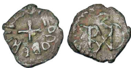
Figura 24. Moneta di bronzo con monogramma di Teodeberto (Schiesser 2018)