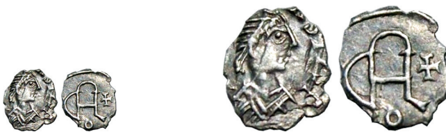
Figure 29-30. Argenteo con monogramma di Clodoveo o di Clodemiro (Schiesser e Vandenbossche 2014b), con riproduzione in scala doppia