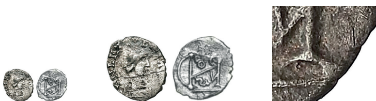
Figure 6-8. Argenteo con «monogramma di Odoacre», rinvenuto a Saint-Etienne-du-Grès (Brenot 1997), con riproduzione in scala doppia e con ingrandimento del particolare in cui si riconosce la presenza della lettera L