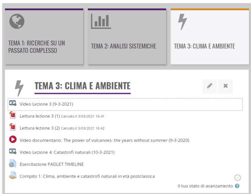
Figura 2 – Sezione