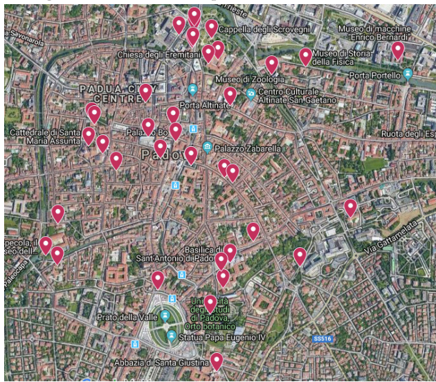
Geospazializzazione (GoogleMaps, 2019).