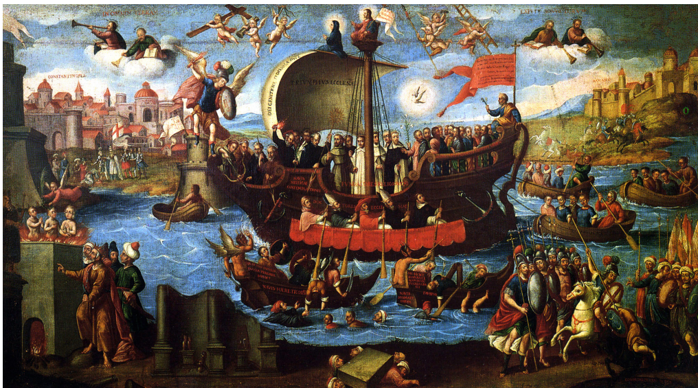
Figura 7. Miguel Jiménez (atribuido), El triunfo de la iglesia ( el vaso de la contemplación mística ), siglo XVIII

Nota. Museo Nacional del Virreinato, Tepozotlán, México.