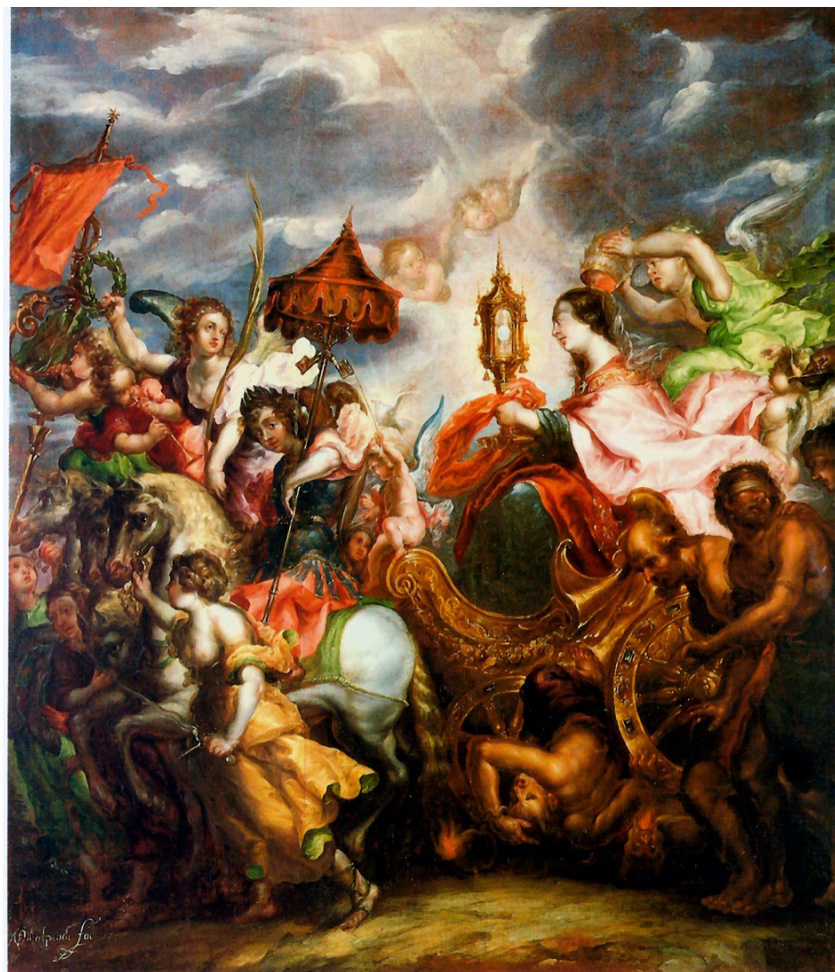
Figura 4. Cristóbal de Villalpando, El triunfo de la Iglesia, 1689

Cristóbal de Villalpando, quien tuvo una intensa actividad artística en Nueva España durante la segunda mitad del siglo XVII. Esta obra se titulada precisamente El triunfo de la Iglesia , de 1689.