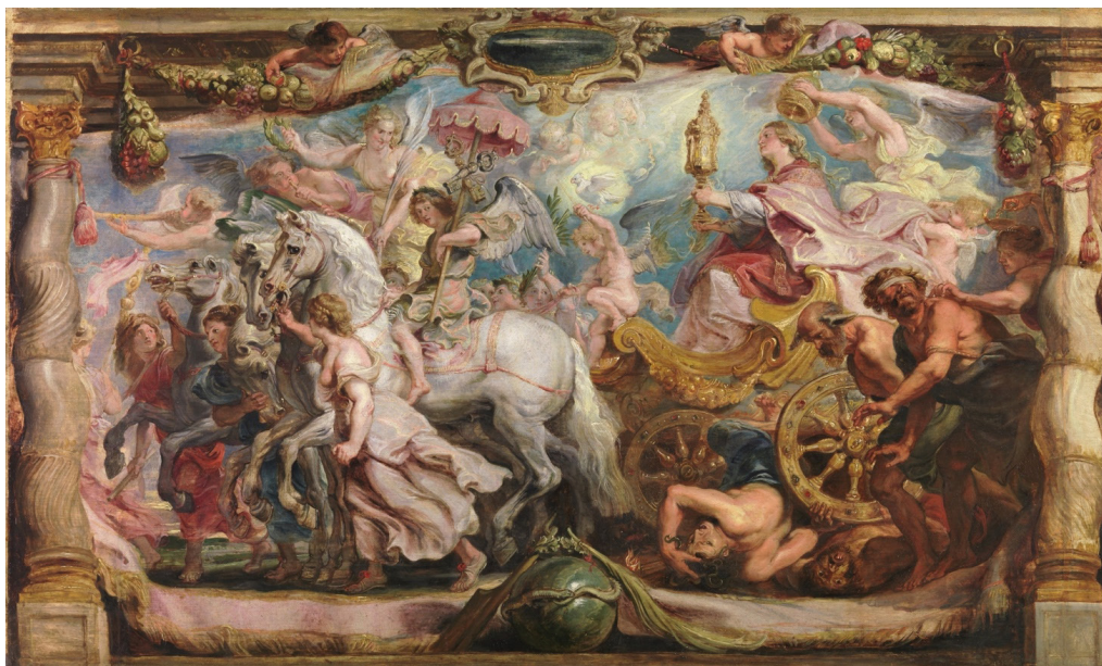
Figura 3. Peter Paul Rubens, El triunfo de la Iglesia, hacia 1625

constitutivas de las alegorías del triunfo de la Iglesia en su expansión por el mundo y que retoman las Sagradas Escrituras y el Arca de Noé. Es la representación exitosa de las trayectorias de la fe guiadas por Cristo, las llaves de San Pedro y los apóstoles que se mueven y convierten las tierras de herejes y bárbaros. Son las naves que se mueven por todo el mundo, en todas las direcciones. El mar que circunda las “cuatro partes” del mundo y que es, al mismo tiempo, el mundo y sus peligros. En las iconografías de Francisco Javier, el mar se movía al compás de las experiencias misioneras del santo jesuita. Desde esa búsqueda, en diversos catálogos electrónicos y en Google con las palabras clave triunfo de la Iglesia , “nave” y “mar”, la llegada a múltiples imágenes, iconografías, óleos sobre tela y frescos de diversas latitudes geográficas era descontada. Ciertamente, predominaba el magnífico “ Triunfo de la Iglesia ” de Rubens, que, en vez de una nave y el mar, es un carro tirado por caballos que aplastan a la herejía con violencia en un desfile triunfante guiado por la Iglesia, personificada en una mujer con una lámpara. El caballo principal que tira el carro porta las llaves de san Pedro y san Pablo (Vergara & Woollett, 2014).