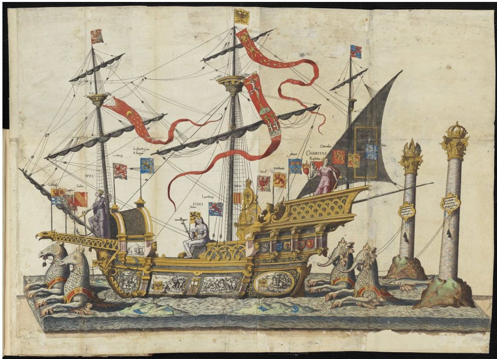
Figura 5. Jean y Lucas Doetecum, La magnifique et sumptueuse pompe funèbre faite aus obseques et funerailles du tresgrand et tresvictorieus empereur Charles Cinquième, celebrées en la Vile de Bruxelles le XXIX Iour du mois de decembre MDL VII par Philippes roy catholiques d'Espagne son fils, 1559